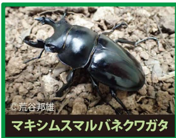
マキシムスマルバネクワガタ