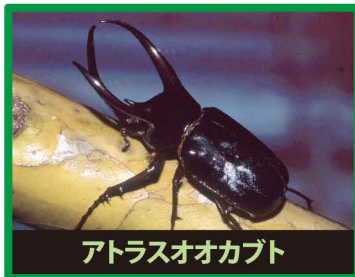
アトラスオオカブト