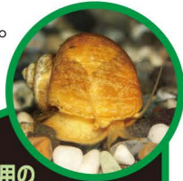
かんしょう用の ゴールデンアップルスネール

つかまえても、他の場所に持って行かないでね。飼っている貝は、池や川に放さないでね。