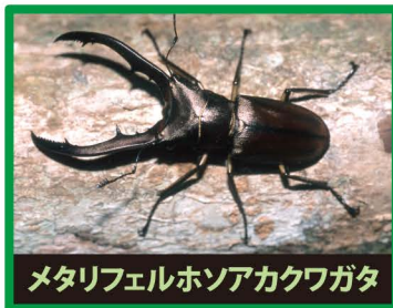
メタリフェルホンアカクワガタ

野外に出ると、日本のカブトムシやクワガタの餌やすみかをうばったり、交雑したり、昆虫の病気を広めたりします。